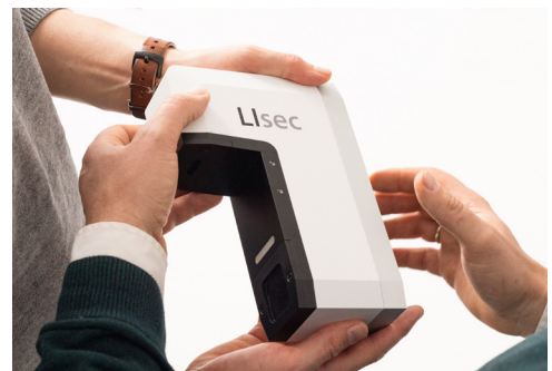
Das gemeinsame DesignLab der TU Dresden und der drei Fraunhofer-Institute IVI, IWS und IWU geht 2022 an den Start.

Wenn also eine AUF ein Zulagenmodell für W-Besoldete entwickelt hat, das einen besonderen Leistungsbezug in einer Höhe bis zu 30.000 Euro zulässt, die Universität aber eine interne Beschränkung auf z.B. 6.000 Euro pro Jahr festgesetzt hat, hat die AUF keine Möglichkeit, den höheren Betrag zu gewähren. Im Jülicher Modell, das im Ergebnis ähnlich konstruiert ist, bei dem die Vergütung jedoch durch die AUF gewährt wird, besteht dieses Problem nicht.