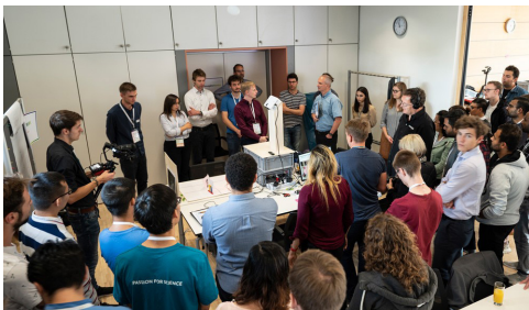
Photonics Days 2019, Fraunhofer IOF

Über die Institutsleitung/Professur verbinden Spitzenforschende universitäre Exzellenz mit der Fraunhofer-Anwendungsrelevanz. Ein beidseitiger flexibler Übergang über die institutionellen Grenzen hinweg stärkt das Gesamtsystem, während die derzeitige Trennung beider Bereiche eine effiziente Führung erschwert. Ein wichtiges Instrument zur Stärkung der Leistungsfähigkeit des Gesamtsystems stellt die Finanzierung von Stellen an der Universität auch durch Fraunhofer dar. Hier führen die derzeit bestehenden Hürden zu massiven Nachteilen des Innovationsstandorts Deutschland im globalen Wettbewerb.