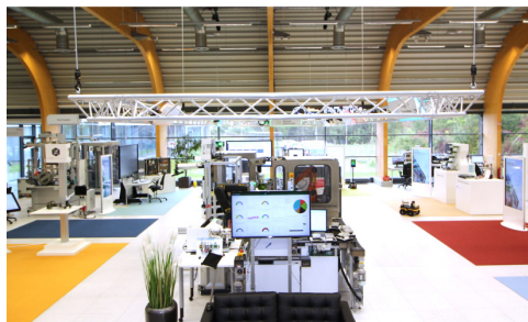
Die SmartFactoryOWL ist das Reallabor für Industrie 4.0 in Ostwestfalen-Lippe (Fraunhofer IOSB-INA und TH OWL, Lemgo)

Die Rolle der Hochschulen für angewandte Wissenschaften bzw. der Fachhochschulen (HAW/FH) im deutschen Wissenschaftssystem hat sich in den letzten beiden Dekaden erheblich gewandelt bzw. erweitert. Durch ihre Nähe zur Berufs- und Arbeitswelt und ihre regionale Verankerung spielen HAW/FH eine wichtige Rolle für den Transfer wissenschaftlicher Erkenntnisse in die Gesellschaft und Wirtschaft. Sie stellen in den Ingenieurwissenschaften einen erheblichen Anteil des akademischen Nachwuchses und spielen gerade für regional ansässige Industrien eine tragende Rolle bei der Rekrutierung von Fachpersonal. In der Politik ist die gezielte Förderung von innovationsorientierter Forschung und Personalentwicklung an den HAW/FH verstärkt ins Zentrum gerückt und der Koalitionsvertrag der neuen Bundesregierung stellt einen Ausbau der bestehenden Förderprogramme in Aussicht.